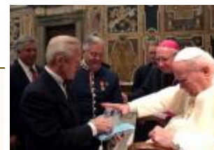
La asociación judía Pave the way fue recibida en Audiencia por el Papa.

CIUDAD DEL VATICANO, martes, 18 enero 2005 ( ZENIT.org ).- Juan Pablo II pidió que se refuerce el compromiso a favor del diálogo entre judíos y católicos al recibir este martes a un grupo de unos 160 rabinos y cantores de Israel, Europa y Estados Unidos.