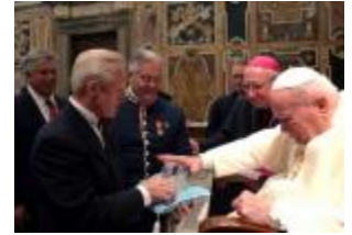
La asociación judía Pave the way fue recibida en Audiencia por el Papa.

CIUDAD DEL VATICANO, martes, 18 enero 2005 (ZENIT.org).- Juan Pablo II pidió que se refuerce el compromiso a favor del diálogo entre judíos y católicos al recibir este martes a un grupo de unos 160 rabinos y cantores de Israel, Europa y Estados Unidos.